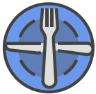
Pasiruošta antram patiekalui