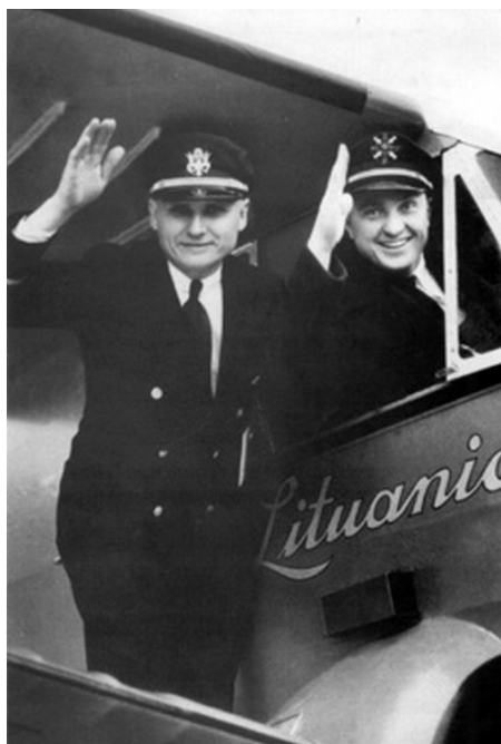
Steponas Darius ir Stasys Girėnas