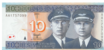
10 litų kupiūra