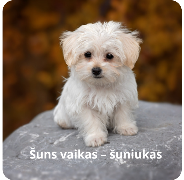
Šuns vaikas – šuniukas

Šuo – ištikimas žmogaus draugas. Dažniausiai šunys laikomi kaip namų augintiniai, o kai kurios šunų veislės saugo avis, ieško sprogmenų, dirba aklų žmonių vedliais. Šunys ėda jiems skirtą maistą.