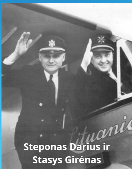
Steponas Darius ir Stasys Girėnas

Steponas Darius ir Stasys Girėnas atvėrė kelią oro paštui tarp Amerikos ir Europos žemynų.