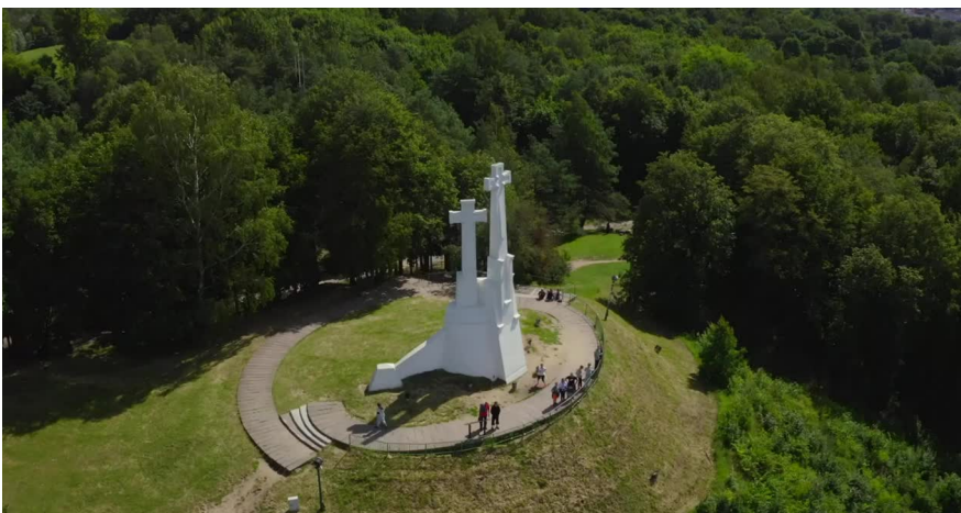
Trijų kryžių kalnas Vilniuje (vidudienis)

3. Dešinėje esančiame paveikslėlyje skirtingomis spalvomis nuspalvinkite pagrindines ir tarpines pasaulio kryptis. Šalia pasaulio krypčių įrašykite jų pavadinimus.