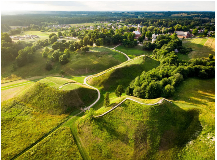
Kernavė iš paukščio skrydžio