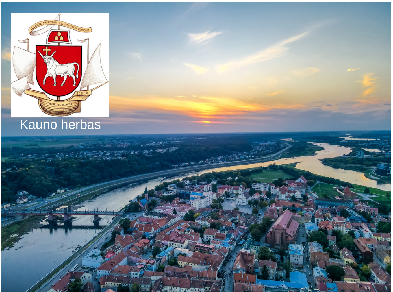
Kaunas – Nemuno ir Neris santakoje