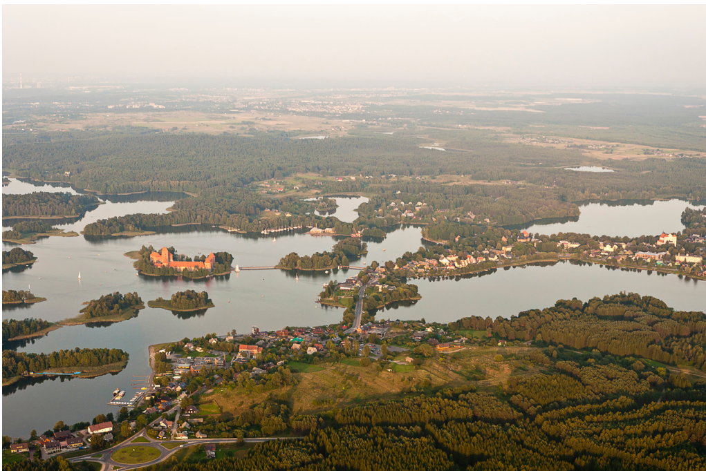
Trakai iš paukščio skrydžio

Pagal „Visuotinė lietuvių enciklopediją“