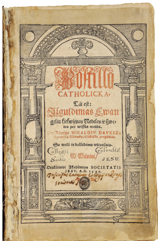
Mikalojaus Daukšos „Postilės“ antraštinis lapas (1599 m.). Vilniaus universiteto biblioteka