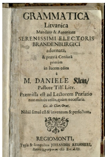
Danieliaus Kleino „Grammatica Litvanica“ (1653 m.) antraštinis lapas

Bendrinės kalbos formavimasis prasidėjo atsiradus pirmiesiems lietuviškiems raštams. Tad Martynui Mažvydui, Mikalojui Daukšai, Kristijonui Donelaičiui ir kitiems to meto kūrėjams teko nelengvas uždavinys – rašmenimis užrašyti šnekamąją kalbą. Pirmieji tekstai buvo rengiami nepaisant gramatikos taisyklių, egzistavo įvairūs žodžių variantai ir jų užrašymo būdai. Tai suvokus, atsirado būtinybė parašyti pirmąją lietuvių kalbos gramatiką .