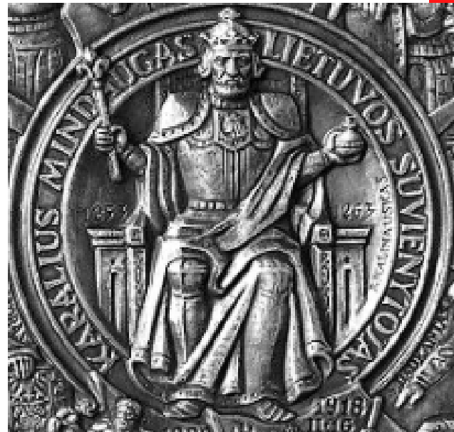
Lietuvos Karalius Mindaugas, Medalio fragmentas