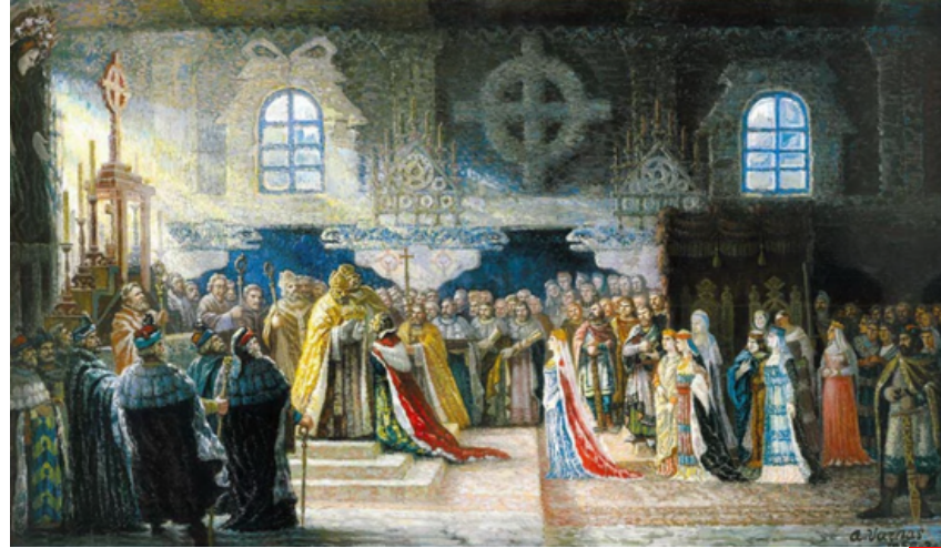
Mindaugo vainikavimas 1253 m. Dail. A. Varnas, 1953.