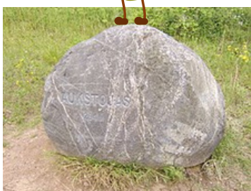
Aukštojo kalno akmuo