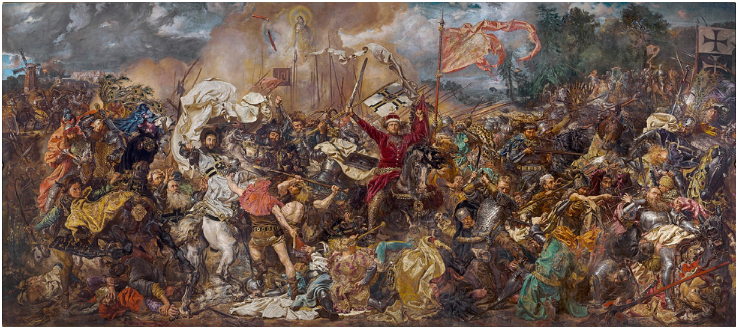
Žalgirio mūšis, Jan Matejko paveikslas 1878 m.

Lietuviai mėgsta didžiuotis, kai laimi Kauno „Žalgirio“ krepšinio ir Vilniaus „Žalgirio“ futbolo sporto klubai. Kodėl garsiausios ir žinomiausios Lietuvos komandos gavo „Žalgirio“ vardą? 1410 m. liepos 15 d. Vytauto ir Jogailos vadovaujama Lietuvos ir Lenkijos kariuomenė sumušė Vokiečių ordino kariuomenę. O legendinis Vytauto atsitraukimas Žalgirio mūšio metu, apgavęs kryžiuočius, nėra tik lietuvių vėliau sumąstyta pasaka – toks klaidinantis manevras išties įvyko ir greičiausiai buvo suplanuotas iš anksto. Žalgirio mūšis tapo reikšmingiausiu, precedento neturinčiu Lietuvos ir Vidurio Europos istoriniu įvykiu, nulėmusiu vokiečių ordino galybės pabaigą. Panagrinėkime, kaip visa tai vyko.