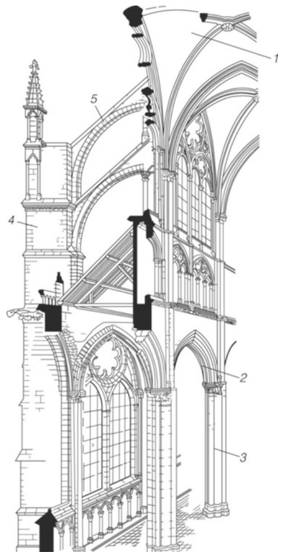
Dievo Motinos katedros Amiens'e konstrukcija: 1 – kryžminis nerviūrinis skliautas, 2 – smailioji arka, 3 – piliorius, 4 – kontraforsas, 5 – arkbutanas