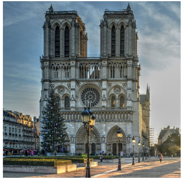
Dievo Motinos katedra. Paryžius. 1200–1250 m.