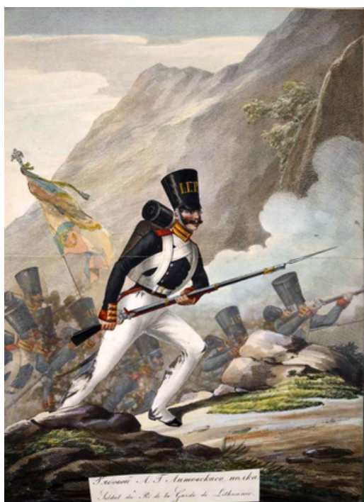
Lietuvos pulko karys

Nors Lietuvos Didžioji Kunigaikštystė žlugo, jos atkūrimo idėja vis dar gyvavo žmonių sąmonėje. Didžioji dalis politiškai aktyvaus gyventojų sluoksnio – bajorijos – išsaugojo politinę tautos savimonę, tebelaikė save istorinės LDK piliečiais. Viltis atkurti žlugusią valstybę atsirado 1830 m., kai sėkminga revoliucija Prancūzijoje ir belgų išsivadavimo kova paskatino lenkų patriotus siekti nepriklausomybės. Gandai, kad caras Nikolajus I rengiasi Lenkijos Karalystėje rinkti rekrutus ir siųsti juos slopinti revoliucijos Vakarų Europoje, tapo sukilimo pretekstu. Vienas sukilimo tikslų – Lenkijos ir Lietuvos federacijos atstatymas, tačiau kai kurie sukilimo vadai siekė ir baudžiovos panaikinimo. Sukilime dalyvavo įvairių luomų atstovai – bajorai, valstiečiai, dvasininkai, miestiečiai.