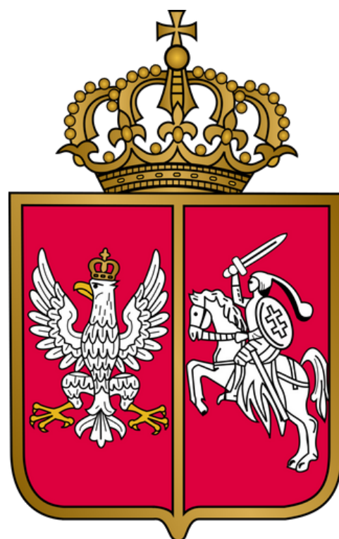
1830 m. sukilėlių herbas

Sukilimas prasidėjo 1830 m. lapkričio 29 d. Varšuvoje. Sukilėliams pavyko nuginkluoti rusų įgulas. Baimindamasi, kad iš Lenkijos sukilimas persimes į Lietuvą, caro valdžia Lietuvoje įvedė karinę padėtį, apribojo susisiekimą su Lenkijos Karalyste, suiminėjo politiškai įtartinus asmenis, atiminėjo ginklus iš gyventojų, tačiau 1830 m. gruodį neramumai kilo ir Lietuvoje. Pirmieji prieš rusų valdžią sukilo Raseinių apskrities miestiečiai ir bajorai. Nuo birželio iki rugsėjo lietuviams talkino Lenkijos reguliarieji kariuomenė, vadovaujama Antano Gelgaudo ir Dezidero Chlapovskio .