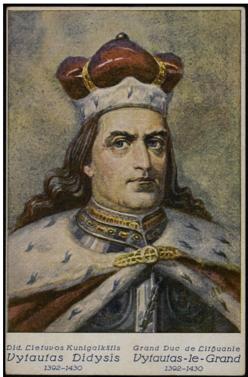
Didysis Lietuvos kunigaikštis Vytautas (1350-1430)