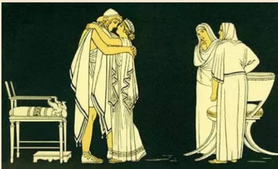
Penelopė sulaukia savo vyro Odisėjo

Naktimis Penelopė išardydavo visą audinį, o kitą dieną pradėdavo austi iš naujo. Jos vardas jau senovėje buvo taurios sutuoktinių ištikimybės simbolis. Dar ir šiandien sakoma – „ištikima, kaip Penelopė“.