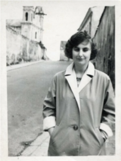
Judita Vaičiūnaitė 1937–2001