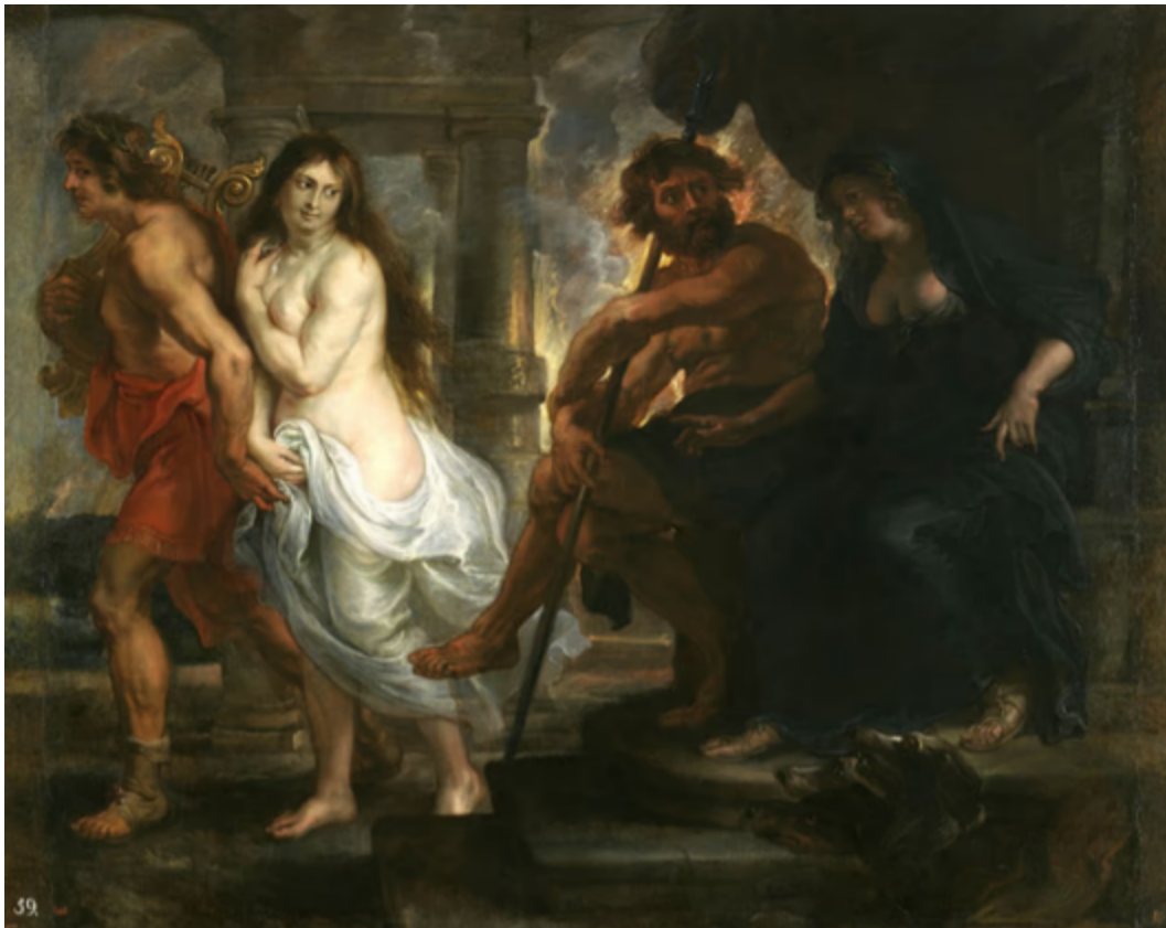
Peter Paul Rubens (1577–1640), Orfėjas ir Euridikė

O štai taip Euridikės išvedimą iš požemio karalystės vaizdavo vienas iškiliausių Baroko laikotarpio dailininkų – Piteris Paulius Rubensas.