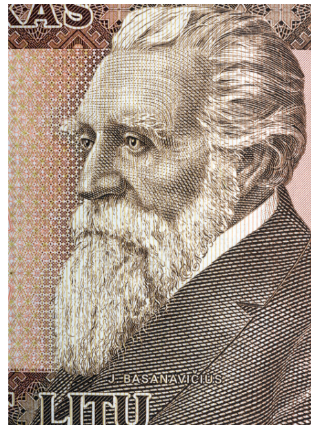
Jonas Basanavičius 1851–1927