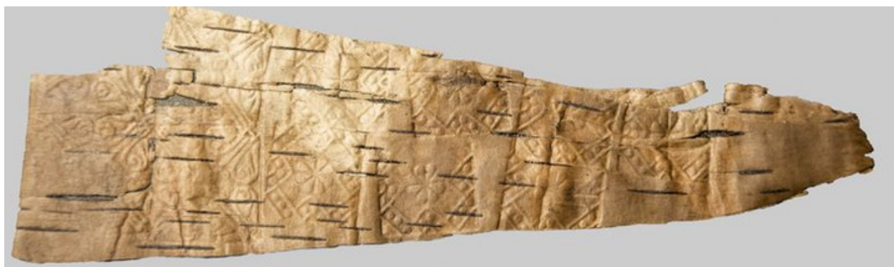
Ornamentuotos beržo tošies fragmentas. Valstybinio Kernavės kultūrinio rezervato direkcija

„Aukštaitijos dainius po gulagų neatsitiesė – eiliavo banaliai, lyg tyčiotūsi iš pavergėjo“