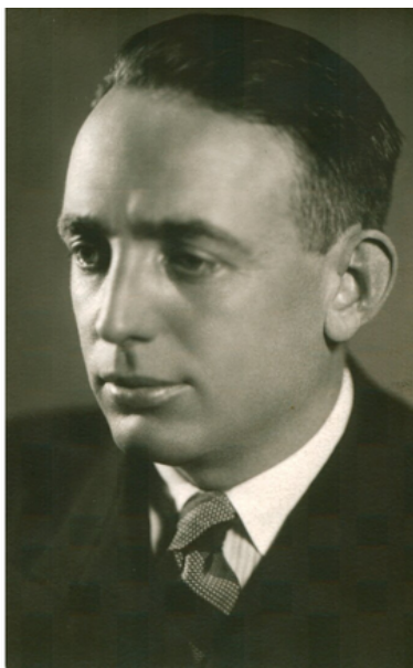
Antanas Miškinis 1905–1983