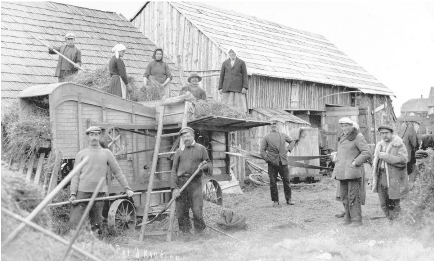
Kūlimo talka Vieکشnių krašte, 1932 m.

Po žemės reformos pagerėjo ūkininkų padėtis. Lietuvoje nuolat didėjo ariamos ir sėjamos žemės plotai, todėl ūkininkai užaugindavo daugiau grūdų. Pradėta sparčiau verstis gyvulininkyste, vis daugiau pagaminama mėsos ir pieno produktų. Lietuviškas sviestas sudarė 75 proc. į Vakarų Europą eksportuojamos produkcijos. Užsieniečiai noriai importuodavo ne tik sviestą, bet ir bekoną, sūrį, kiaušinius, arklius, grūdus ir miltus. Už parduotus produktus gauti pinigai buvo skirti krašto gerovei.