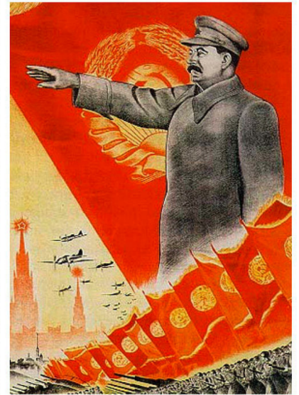
Nacstinės Vokietijos ir komunistinės Sovietų Sąjungos propagandiniai plakatai.