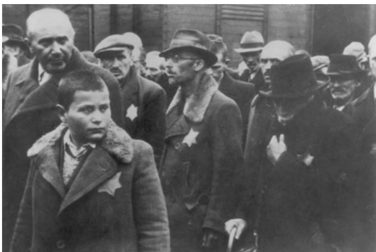
Žydus holokausto metu iš minios išskirdavo ant rūbų prisiūdami Dovydo geltoną žvaigždę