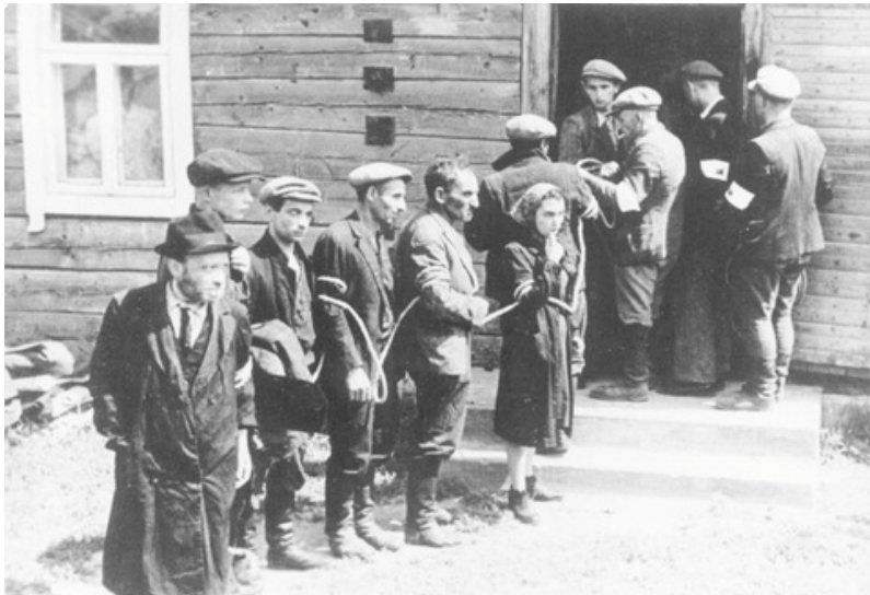
1941 m. liepos mėn. Tautinio darbo apsaugos bataliono sugauti ir surišti žydai