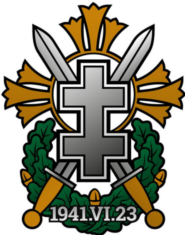
Birželio sukilimo emblema

Lietuvos miestuose žydai buvo suvaryti į getus. Juose teko gyventi ypač sunkiomis, žmogaus orumą žeminančiomis sąlygomis. Žydai privalėjo prie viršutinių drabužių prisisiūti šešiakampes žvaigždes. Jiems buvo draudžiama naudotis transporto priemonėmis, turėti radijo imtuvus, pirkti ir parsinešti į getus maisto, kuro, be leidimo išeiti iš getų, vaikščioti šaligatviais. 1941–1944 m. getuose gyvenę žydai buvo palaipsniui sunaikinti. Lietuvoje per vokiečių okupaciją iš viso nužudyta apie 195–196 tūkstančiai žydų – apie 90 procentų vietinės bendruomenės. Tai didžiausias aukų procentas tarp Europos šalių, kurios patyrė Holokausto siaubą. Lietuviai ne tik žudė savo bendrapiliečius žydus, bet ir, nepaisydami realios grėsmės, gelbėjo. Lietuvos teritorijoje daugiau kaip 2300 šeimų gelbėjo žydus. Prie žydų gelbėjimo prisidėjo ir Lietuvos katalikų bažnyčia, nemažai kunigų suteikdavo prieglobstį nuo mirties besislapsčiusiems žydams. Lietuvių šeimos dažniausiai priglausdavo žydų vaikus, juos priimdavo ir augindavo lyg savus.