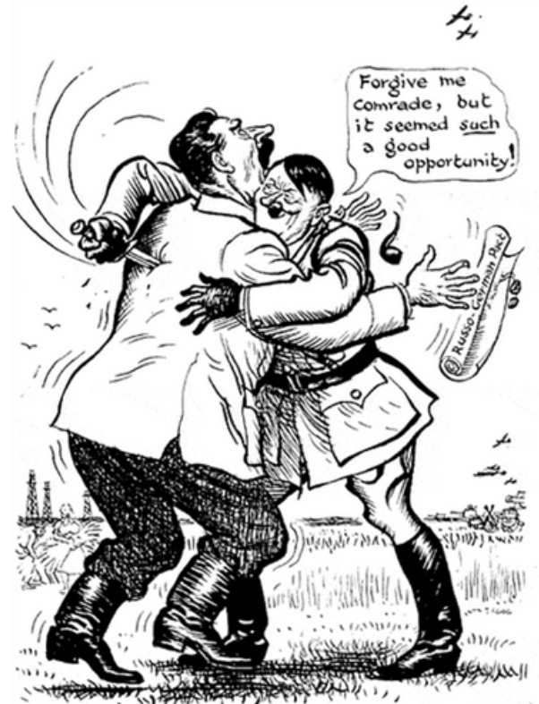
Užrašas karikatūroje: „Atleisk man, drauge, bet pasitaikė tokia galimybė.“