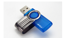
angl. flash memory