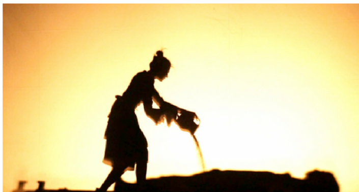
Gintaro Varno spektaklis „Oidipo mitas. Tėbų trilogija“. Antigonė laidoja savo brolių.