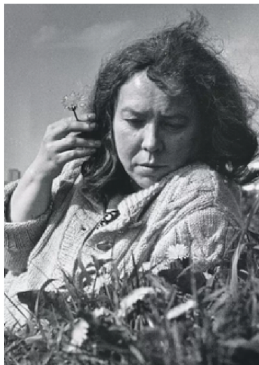
Janina Degutytė tarp Vilniaus pienių.

Janina Degutytė (1928–1990) – viena žymiausių lietuvių poečių, vertėja, eilėraščių ir pasakų knygų vaikams autorė. Gimusi Šančiuose, Kauno priemiestyje, dar mokydamasi Kauno VII gimnazijoje parašė pirmuosius eilėraščius. Vilniaus universitete studijavo lietuvių kalbą ir literatūrą, mokytojavo Tauragėje, Nemenčinėje, 1958 m. pradėjo dirbti Valstybinėje grožinės literatūros leidykloje redaktore Vilniuje. Kūrybai būdingos lyrinės nuotaikos, melodingumas, jausmingumas, gamtos, tautosakos, kultūros motyvai. Garsiausi kūriniai – eilėraščių rinkiniai „Ugnies lašai“, „Pilnatis“, „Šiaurės vasaros“, „Tarp saulės ir netekties“, „Purpuru atsivėrusi“, „Purpuro valanda“, pasakos, eilėraščiai vaikams „Pelėdžiuko sapnas“, „Nepalik manęs“. Kūrinių išversta į anglų, prancūzų, ispanų, švedų, vokiečių, slovakų, lenkų, latvių ir kitas kalbas. Eilėraštis „Antigonė“, parašytas 1966 metais, sukurtas pagal Sofoklio tragediją „Antigonė“.