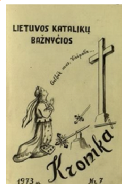
Pagrindinis leidinys „Lietuvos Katalikų Bažnyčios kronika“, 1973 m.

4. Už ką teisiama F. N. Sadūnaitė? Kodėl jai svarbu ginti „Lietuvos Katalikų Bažnyčios kroniką“?