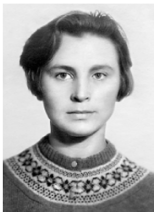
Felicija Nijolė Sadūnaitė.

3 užduotis. Susipažinkite su lietuvių kovotojos už žmogaus teises ir Lietuvos laisvę vienuolės Felicijos Nijolės Sadūnaitės pristatymu. Perskaitykite jos apologijos (gynimosi kalbos) ir paskutinio kaltinamosios žodžio ištraukas ir bendradarbiaudami atlikite užduotis.