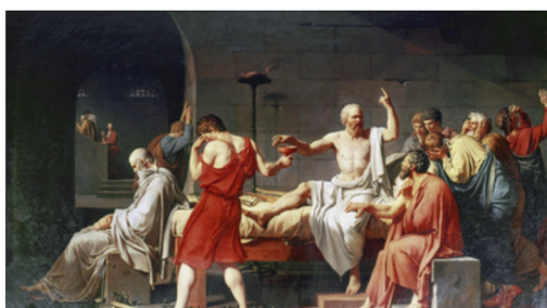
Žakas Lui Davidas (Jacques-Louis David). „Sokrato mirtis“, 1787 m.

Štai jums, piliečiai, ir visa teisybė. Nieko nenuslėpiau nuo jūsų, nieko nenutylėjau. Tačiau esu beveik tikras, kad šiuo atvirumu užsitraukiu neapykantą, bet kaip tik tai ir rodo, kad sakau tiesą, ir kad dėl to mane šmeižia, ir kad tokios yra šmeižto šaknys. Ir jei dabar ar kada vėliau imsite nagrinėti mano bylą, rasite tą pat.