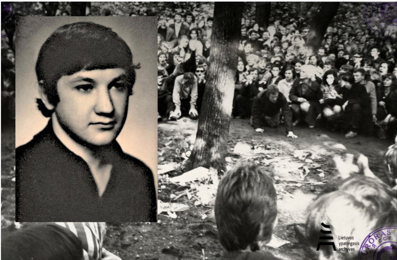
Romas Kalanta 1953–1972.

Laisvės siekiai prasiverždavo ir viešai. Iššūkiu režimui tapo 1972 m. gegužės 14 d. Kauno miesto sode, prie Muzikinio teatro, protestuodamas prieš tarybinį režimą, sušukęs „Laisvę Lietuvai!“, devyniolikmetis Romas Kalanta apsipylė benzinu ir susidegino. Jo užrašų knygelėje liko įrašas: „Dėl mano mirties kalta tik santvarka.“ Įvykiai Kaune sukėlė LKP ir KGB pareigūnų sumišimą (panašus įvykis užfiksuotas ir Čekoslovakijoje: per Prahos pavasarį susidegino Jan Palach). Kelias dienas trukusias tūkstantines demonstracijas jėga išvaikė sovietų milicija, specialūs vidaus kariuomenės būriai. Suimta per 400 žmonių, aktyviausi dalyviai nuteisti kalėti. Siekdama nuslėpti tikruosius R. Kalantos poelgio motyvus valdžia apšmeižė laisvės kankinį – paskelbė sunkiu psichikos ligoniu. Neįtikėtino laisvės proveržio istorija buvo prisimenama iki pat nepriklausomybės atkūrimo.