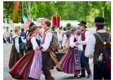
Folkloro festivalio „Skamba skamba kankliai“ dalyviai, 2017 m.

Pagal „Visuotinę lietuvių enciklopediją“