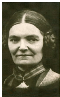
Šatrijos Ragana.