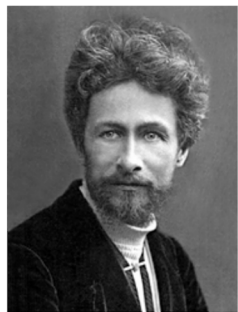
Vydūnas.

Pasibraukite svarbias mintis, nežinomus žodžius išsiaiškinkite žodyne (žr. Naudingos nuorodos ).