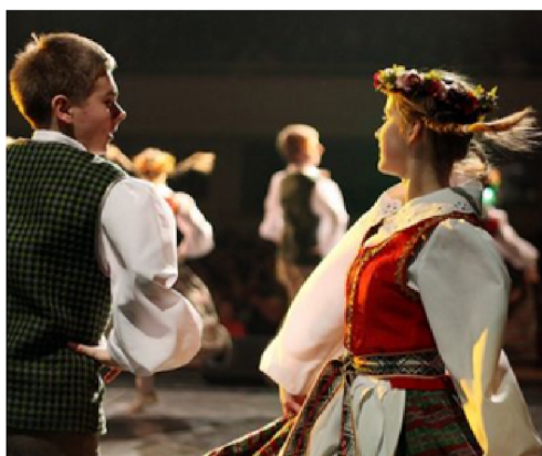
Lietuviškų tautinių šokių kolektyvas.

Sujungiamųjų sakinių dėmenys, susieti: a) priešinamaisiais ir paremiamaisiais jungtukais ar jų paskirtį turinčiais žodžiais o, bet, tačiau, tik(tai), vis dėlto, (per) tai, užtai, užtat(ai), tad, todėl ir kt., b) jungtukų ir jungiamųjų žodžių samplaikomis o vis dėlto, bet vis dėlto, bet užtat ir kt., yra atskiriami kableliu (rečiau kabliataškiu ).