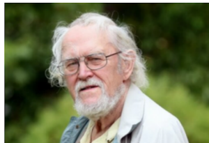
Marcelijus Martinaitis.