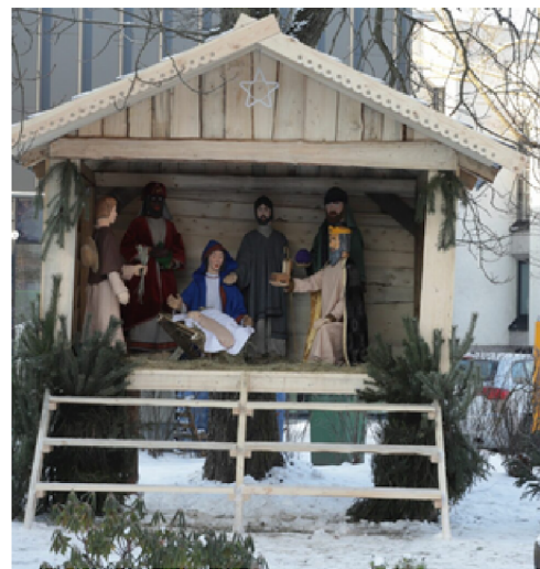
Kalėdų prakartėlė Panevėžyje.

Graikai, šventę Dionisijas, kurių gaivalingas, visa apimantis, ekstaziškas, šiuolaikiniam žmogui nebesiekiamas dionisiškasis džiaugsmas jau irgi virto mitu, sudėjo keistą ir šurpią legendą.