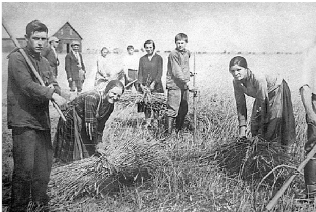
Javapjūtė Kupiškio apskrityje 1929 m.