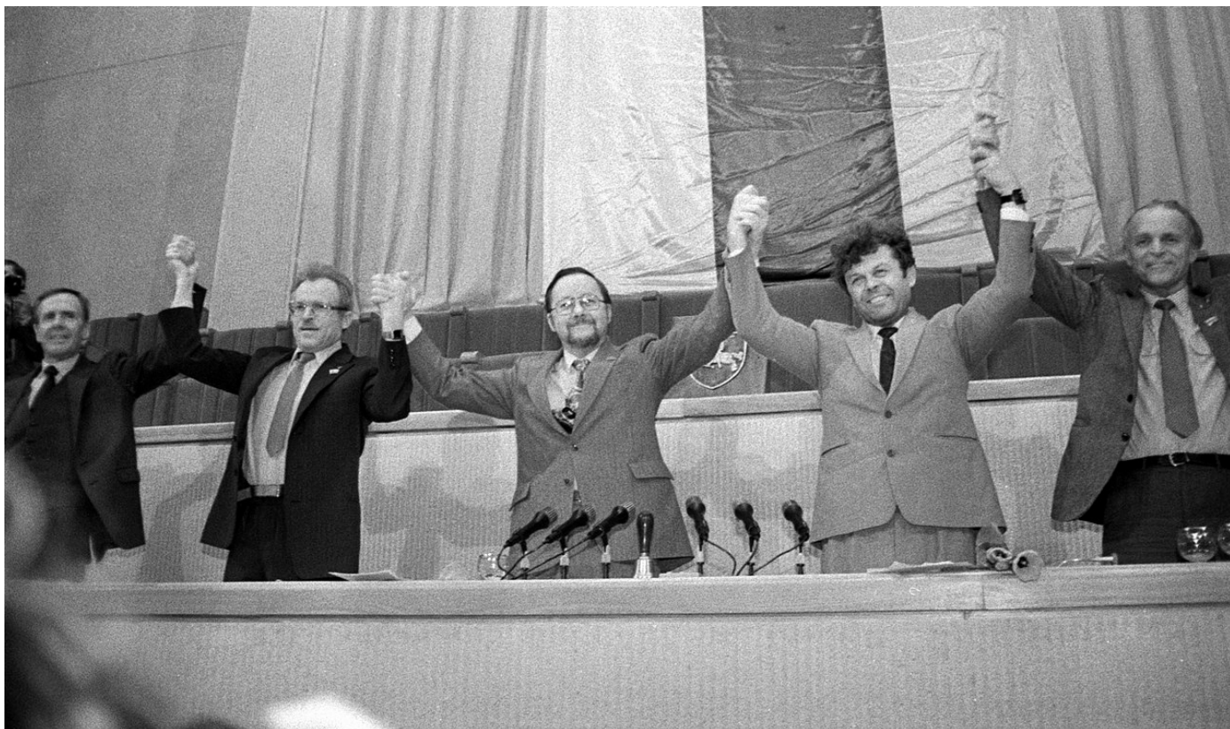
Lietuvos Aukščiausiosios Tarybos-Atkuriamojo Seimo vadovai 1990 m. kovo 11 d. Vilniuje po akto dėl Lietuvos nepriklausomos valstybės atstatymo paskelbimo

Laisvėjant politinei atmosferai SSRS, 1990 m. vasario 24 d., buvo suorganizuoti pirmieji laisvi ir demokratiniai rinkimai į Lietuvos TSR Aukščiausiąją Tarybą. Juos laimėjo Sąjūdžio kelti ar remti kandidatai. Aukščiausiosios Tarybos pirmininku per visą jos darbo laiką buvo 1990 m. kovo 11 d. išrinktas Vytautas Landsbergis, rinkimuose nugalėjęs paskutinį Tarybų Lietuvos LKP CK pirmąjį sekretorių Algirdą Mykolą Brazauską. Tik pradėjusi darbą Aukščiausioji Taryba 1990 m. kovo 11 d. priėmė Lietuvos Nepriklausomybės Atkūrimo Aktą, skelbusį Lietuvos nepriklausomybės atkūrimą. 1990 m. balandį TSRS pradėjo Lietuvos ekonominę blokadą, kuri pristabdė Lietuvos ekonominę plėtrą, o užsienio valstybės Lietuvos nepriklausomybės atkūrimą pripažinti dėsė. Dangstytasi formalia priežastimi, kad Lietuva nepriklausomybės atkūrimą skelbė okupacijos sąlygomis ir parlamentas buvo išrinktas pagal okupacijos metu galiojusius įstatymus.