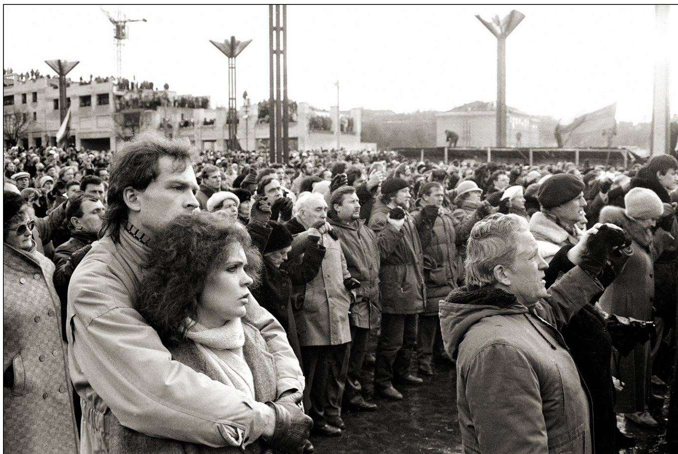
1991 m. Sausio 13-oji.