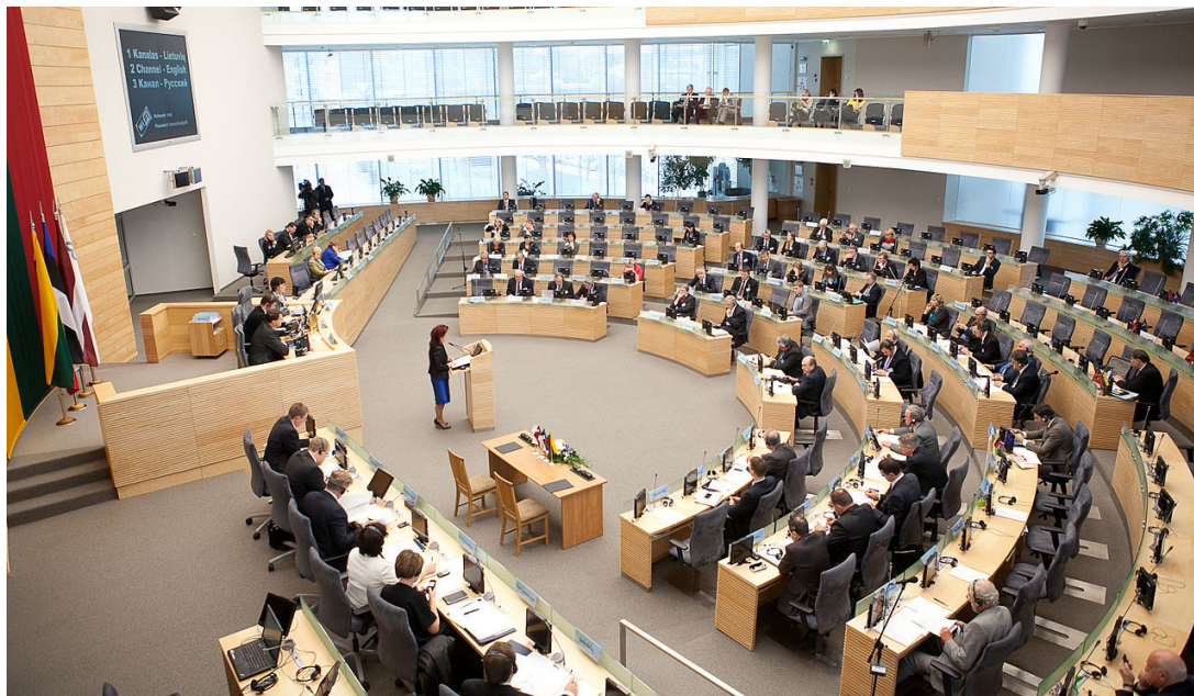
2007 m. įrengta Seimo posėdžių sale

2. Išnagrinėkite lentelę „Rinkimai į Lietuvos Respublikos Seimą 1992–2020 m.“ ir atsakykite į klausimus.