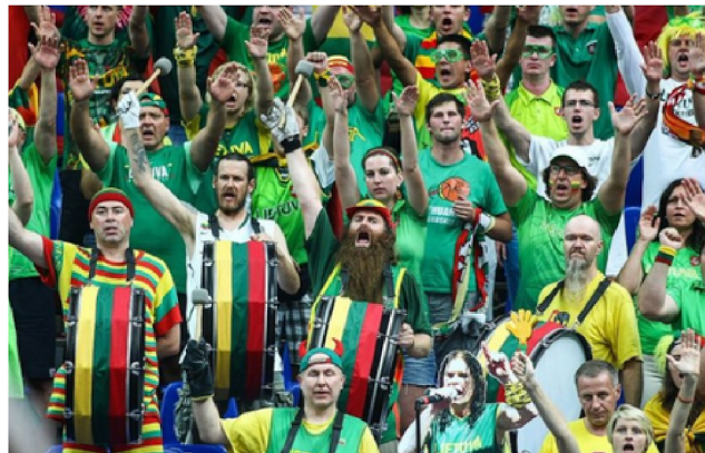
Lietuvos krepšinio sirgaliai.

Žiūrovai susirenka ne dialogo tarp tautų ir kultūrų, o tik kraujo. Ir kuo daugiau, tuo geriau. Kuo labiau bus pažemintas, sutriptytas priešininkas, tuo malonesni jausmai. Užmušk savo artimą – toks devizas kabo ant stadiono vartų. Tai, tiesą sakant, labai normalu. Nors ir bjauru. Tai instinktas. Žmogus kaip individas yra plėšrus, egoistiškas, savanaudis padaras. Jis jungiasi į didesnes grupes tik dėl to, kad vienas negali užmušti savo artimo.