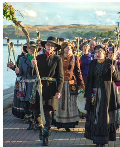
Joninių šventė Kuršių Nerijoje. „Tek saulužė ant maračių“.

Yra žinoma keliolika tūkstančių lietuvių liaudies dainų ir apie pusę milijono jų variantų. Lietuvių liaudies dainose atsispindi žmogaus dvasinės būsenos. Jų pasaulėvaizdis dažniausiai lyriškas, intymus, kuriama nuotaika gali būti džiugi, humoristinė arba liūdna. Dainų kompozicija įvairi. Lietuvių liaudies dainose vyrauja lyriniai pasakojimai ir aprašymai, kaitaliojami su monologais ir dialogais. Lyrinis pasakojimas gali sieti keletą veikėjų. Meniniam vaizdui būdingi paralelizmai, palyginimai, metaforos, simboliai, epitetai, deminutyvai. Intonacinė-sintaksinė dainų sandara simetriška, daug pakartojimų; labai svarbūs priedainiai (ypač sutartinių). Lietuvių liaudies dainų melodijos santūrios, joms būdingas ramus melodinės linijos bangavimas. Liaudies dainos yra kolektyvinės žmonių kūrybos rezultatas.