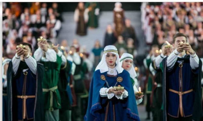
Lietuvos šimtmečio dainų šventė „Vardan tos“, 2018 m.