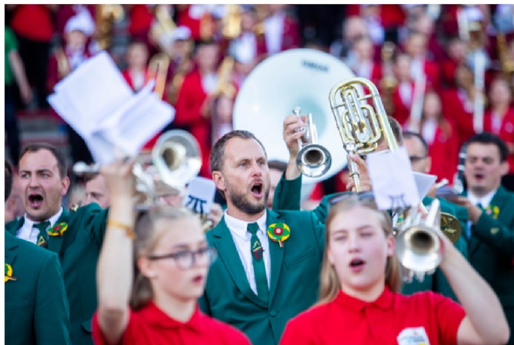
Dainų šventė 2018 m.