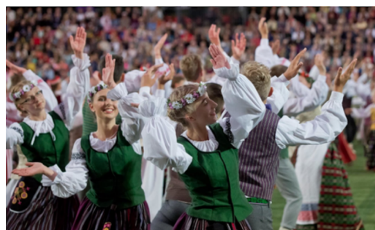
Dainų šventė.

Dainų ir šokių šventės tradicija buvo ir yra Lietuvoje svarbus, daugiaprasmiškas reiškinys.