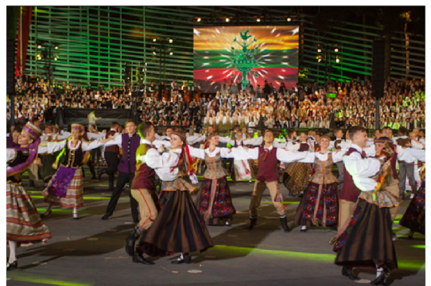
2018 m. Lietuvos šimtmečio dainų šventės Ansamblių vakaras.

D _____ A _____ I _____ N _____ U _____ Š _____ V _____ E _____ N _____ T _____ Ė _____