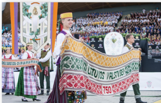
2014 m. Dainų šventės Dainų diena Vilniuje, Vingio parke.

Pagal Beatričę Laurinavičienę ir Vytautą Jakelaitį