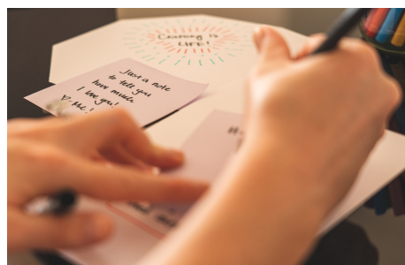
laiškais, žinutėmis, elektroniniais laiškais