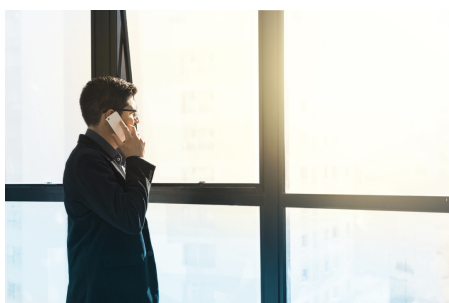
telefonu, balsu žinutėmis