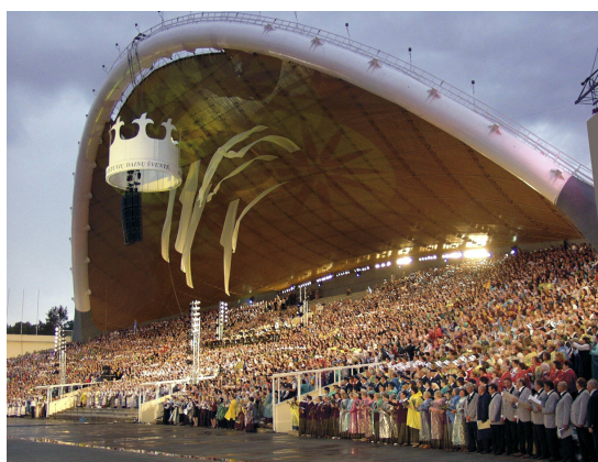
Dainų šventė

Dainų ir šokių šventės tradicija Lietuvoje gyvuoja daug metų. Ši šventė kas ketverius metus į didžiulius šventinius renginius Vilniuje suburia įvairių sričių mėgėjų meno kolektyvus ir profesionalaus meno atstovus iš Lietuvos ir įvairių pasaulio šalių. Dainų šventėse kasmet dalyvauja per 40 tūkstančių dalyvių. Šios šventės idėja perduodama iš kartos į kartą, su ja augama nuo vaikystės. Ši tradicija perduodama šeimose, mokyklose, kultūros įstaigose, nevyriausybinėse organizacijose. 2008 m. Baltijos valstybių Dainų ir šokių šventės įrašytos į Reprezentatyvųjų žmonių nematerialaus kultūros paveldo sąrašą.