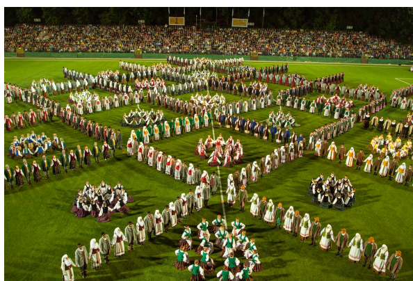
2018 m. Lietuvos šimtmečio dainų šventės Šokių diena

Dainų švenčių tradicijos ištakos glūdi 19 a. vidurio Vakarų Europoje. Pirmoji tokia šventė buvo surengta 1843 m. Šveicarijoje, vėliau išpopuliarėjo Vokietijoje. Dainų švenčių tradicija atkeliavo ir į Baltijos valstybes, pirmiausia – į Estiją ir Latviją, vėliau – į Lietuvą. Iš pradžių dainų šventėmis buvo vadinami kelių chorų jungtiniai koncertai. Pirmoji visos Lietuvos dainų šventė įvyko 1924 m. Kaune.