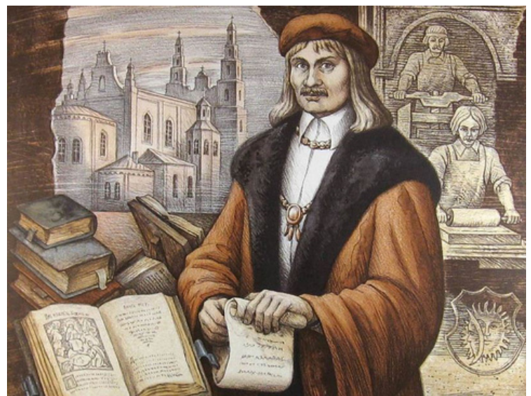
Pranciškus Skorina (1486–1551).