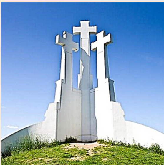
Trijų kryžių kalnas