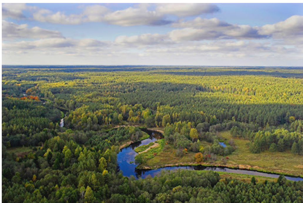
Anykščių šilelis ir Šventosios upės vingis.