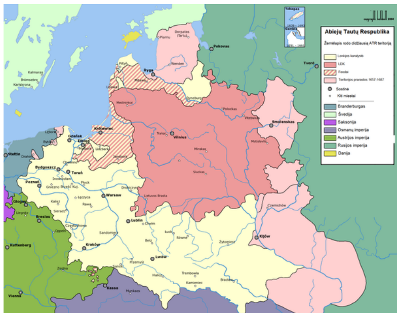
Abiejų Tautų Respublikos teritorija