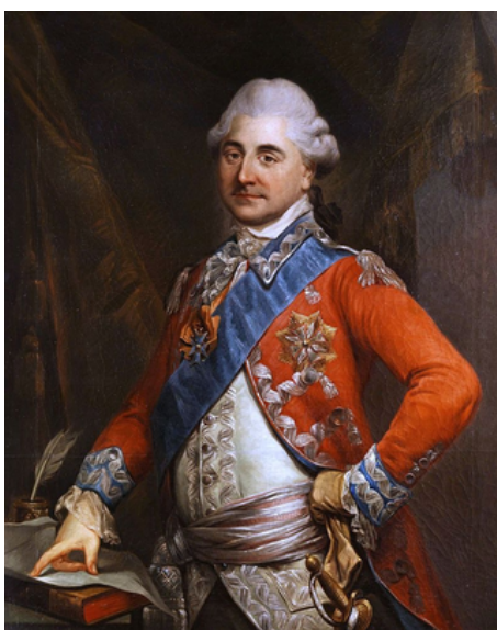
Stanislovas Augustas Poniatovskis. Dailininkas Marcello Bacciarelli

Nepatenkinti Čartoriskių reformomis bajorai susibūrė į Radomo konfederaciją . Jie tikėjosi pašalinti iš valdžios karalių ir Čartoriskius, nutraukti jų 1764 m. pradėtas valstybės reformas. Rusijos kariuomenės apgultoje Varšuvoje Radomo konfederacijos veikėjai priėmė vadinamąją Varšuvos sutartį, pagal kurią Respublika tapo teisiškai priklausoma nuo Rusijos. Šio sutarties priešininkai 1768 m. suorganizavo Baro konfederaciją , tačiau Rusijos pajėgos konfederatus sumušė.