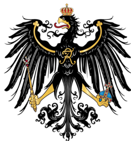
Rusijos, Austrijos ir Prūsijos imperijų herbai

Po Liublino unijos, XVII a., ATR dar buvo stipri, tačiau mirus paskutiniajam ATR karaliui Žygimantui Augustui karaliais pradėti rinkti užsieniečiai. XVII a. dėl Livonijos (ir kitų teritorijų bei interesų) teko nuolat kovoti su Rusija ir Švedija. Nuolatiniai karai, silpna karaliaus valdžia alino valstybę. Vidurio rytų Europos regione ėmė vyrauti Rusija, Prūsija ir Austrija. XVII–XVIII a. karai, vykę beveik be pertraukų, Lietuvai padarė didelių nuostolių: ištuštėjo iždas, LDK kelis kartus buvo užėmusios Rusijos, Švedijos kariuomenės, kurios siaubė kaimus ir miestus. Gyventojus plėšė ne tik svetima, bet ir sava kariuomenė (nes ji buvo samdyta, o pinigų užmokesčiui trūko). Nemažai gyventojų žuvo nuo kareivių rankų, bet dar daugiau nuo bado bei maro (1708–1711) – iš viso mirė daugiau nei trečdalis gyventojų. „Apsaugok, Dieve, nuo karo, maro ir bado“, – sakydavo tų laikų žmonės. Išnyko daug sodybų, ištisi Lietuvos plotai virto dykromis. Ūkis po karo buvo visiškai sunaikintas. Didikai buvo prasiskolinę, jų dvarai išdeginti, valstiečiai išmirę, išvaikyti ar išbėgioję. Lietuvos ūkis po Šiaurės karo labai greit teatsigavo (tik XVIII a. antroje pusėje).