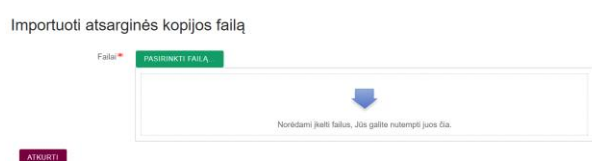
2 pav. Kurso archyvo įkėlimas